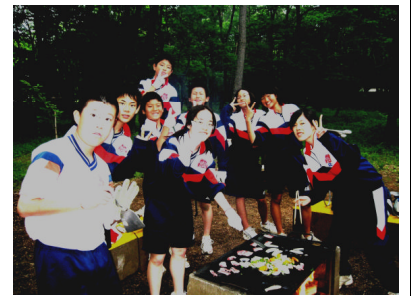
(つくる喜び, 食べる喜び→)

5月28日・29日の2日間, 2年生は, さしま少年自然の家で集団宿泊学習を行いました。2年生の宿泊学習は初の試み, 目標は「チャレンジ」。テントの設営や炊飯では悪戦苦闘, まさにチャレンジの連続でした。不便の中で, 自主的に行動しなくては解決できないことや協力することの大切さを実感したようです。集団生活のルールやマナーも改めて学ぶことができました。キャンプファイヤーで歌い踊ったこと, テントの中で友と語り合ったことはいつまでも思い出に残ることでしょう。