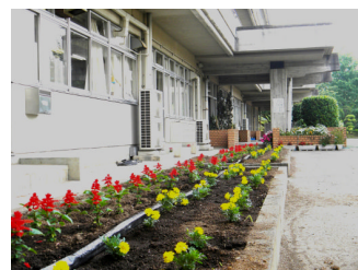
(↑サルビア&マリーゴールド)