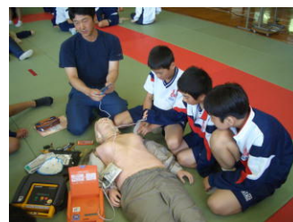
(↑2年生の普通救命講習)