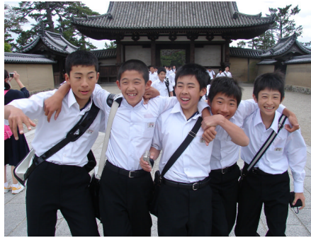
(↑忘れられない旅の思い出)

そして何よりもうれしかったことは, 3年生82名全員が参加できたことです。友達よさを再発見し, 中学時代のよき思い出が沢山できました。