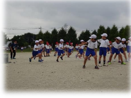
バトン渡しに重点を置いたリレー練習