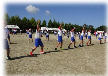
3・4年生の力強いソーラン