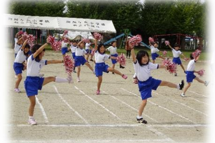
1・2年生のかわいいダンス