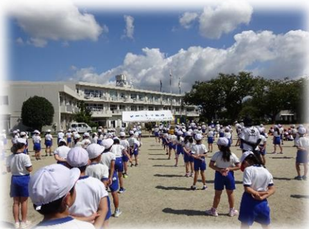
整列した姿が素晴らしい全体練習

10月3日(土)の運動会に向けて、練習に力が入る子供たち。表現運動では、休み時間を使って自主的に練習をする姿も見られます。限られた時間と条件の中で、精一杯の力を出そうと頑張る姿に、頼もしさを感じます。各御家庭には、御来校に際しまして、検温カードの提出や健康管理等のお願いをしております。変更等も多々あり、御迷惑をおかけしているところですが、御理解と御協力をいただきますようお願い申し上げます。