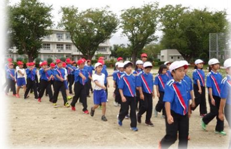
5・6年生の美しい集団行動