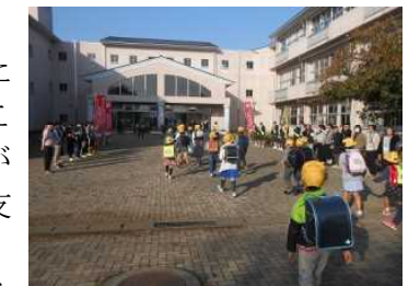
子供たちの安全のために

つきましては，「こどもを守る110番の家」に登録していただいております保護者の皆様に，子供たちの安全確保に向けてこれまで同様にお力添えをいただき，登下校時の安全確保の取組がより一層推進できますようお願い申し上げます。今後とも，ご支援ご協力のほど，よろしくお願い申し上げます。プレートの追加・お取り替え等ございましたら学校(担当：教頭)までお知らせください。